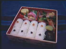
幕の内弁当用俵玉。