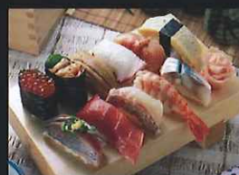
にぎり寿司用しゃり玉。