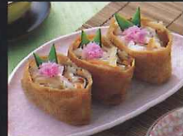
いなり寿司用いなり玉。