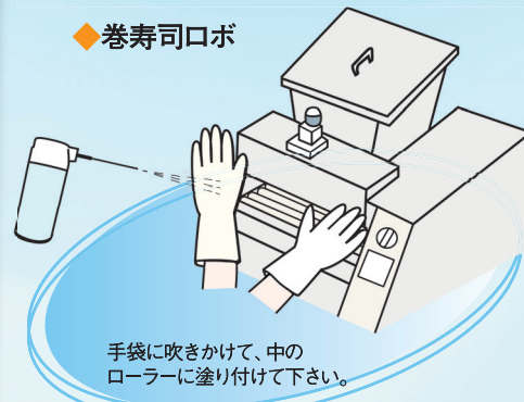
【スポットスプレー使用例】