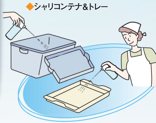
【スポットスプレー使用例】